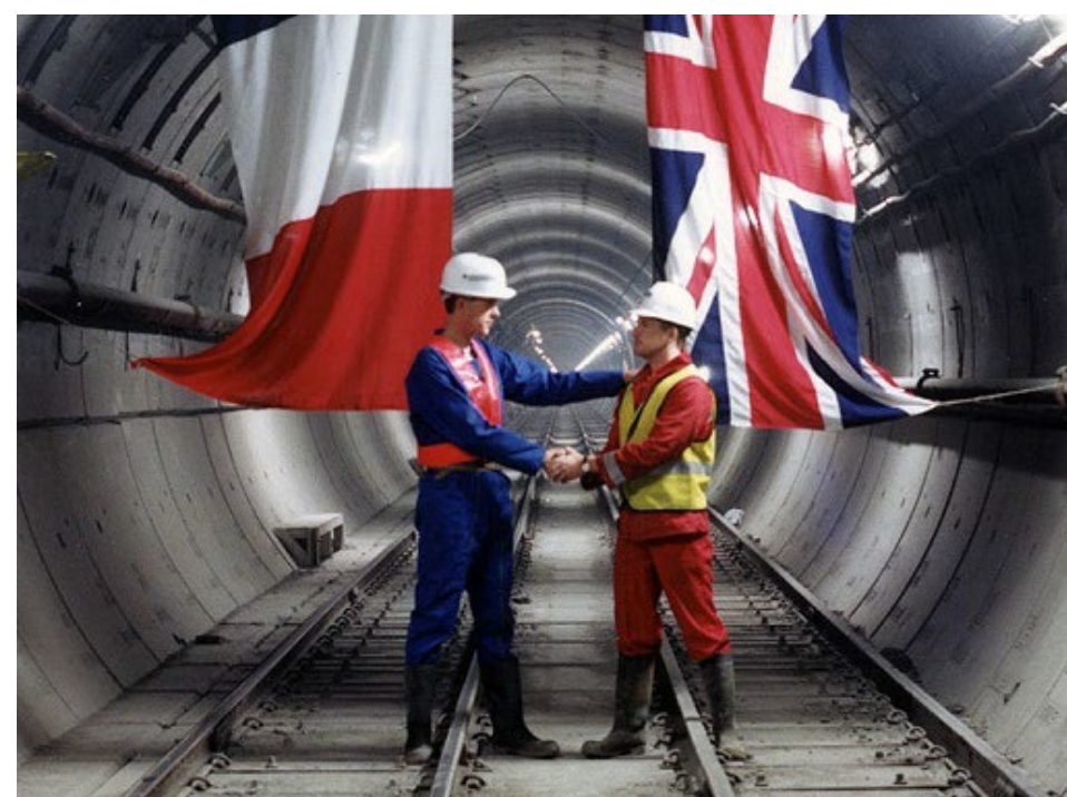
Тоннель через Ла-Манш 5 экспертов

! Долгосрочный контракт в условиях неопределенности санкционного регулирования