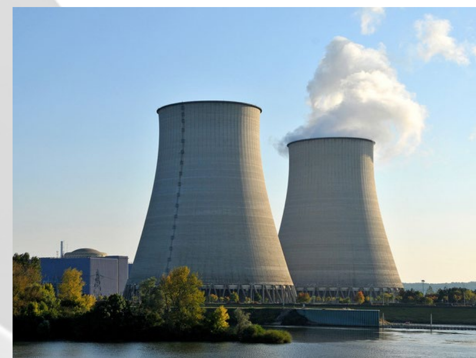
АЭС Ханкиви-1 3 эксперта

▶ Среднее вознаграждение Совета от 0.05 до 0.15% от стоимости проекта (делится между сторонами)