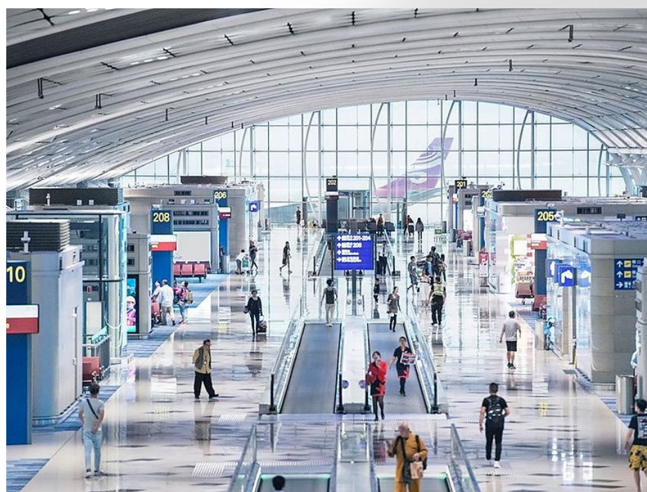
Аэропорт в Гонконге 7 экспертов

✓ Включаем условия об альтернативном урегулировании (напр., DRB)